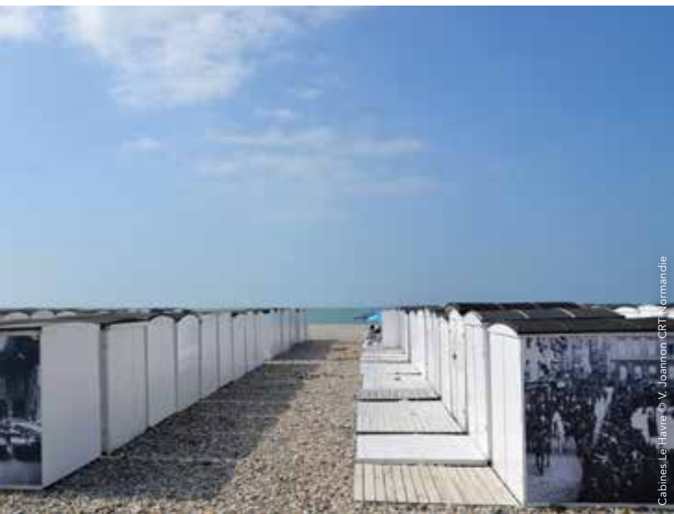
Cabines Le Havre

186 bd Clemenceau, BP 649 - 76059 Le Havre Cedex Tél. : 02 32 74 04 04 / www.lehavretourisme.com