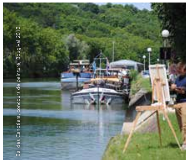
Bal des Canotiers, concours de peinture, Bougival 2013

Haut lieu du canotage, des bals et des guinguettes, Bougival fut très prisée des Impressionnistes. Suivez le parcours sur les pas de Sisley, Morisot, Monet, Pissarro. Il est encore possible de découvrir les paysages de cette charmante petite ville en bord de Seine, tels que les peintres les ont connus.