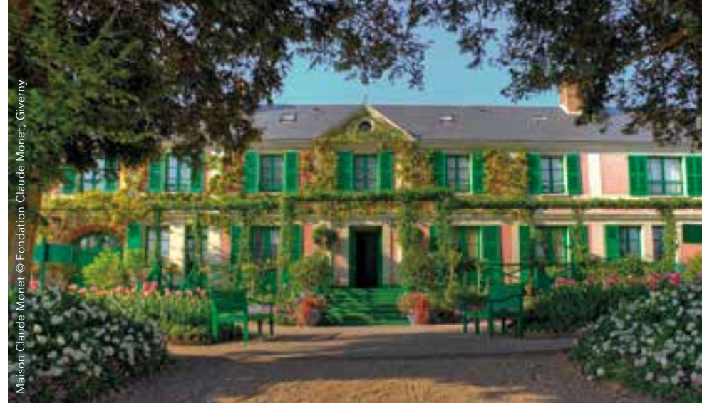
Maison Claude Monet

99 rue Claude Monet, 27620 Giverny Tél : 02 32 51 94 65 / www.mdig.fr Ouvert du 24 mars au 5 novembre 2017 Entrée libre le 1 er dimanche de chaque mois. Fermeture des salles principales pour changement d'exposition temporaire du 3 au 13 juillet