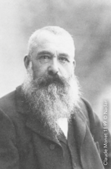
Claude Monet 1899