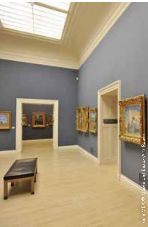
salle MBA