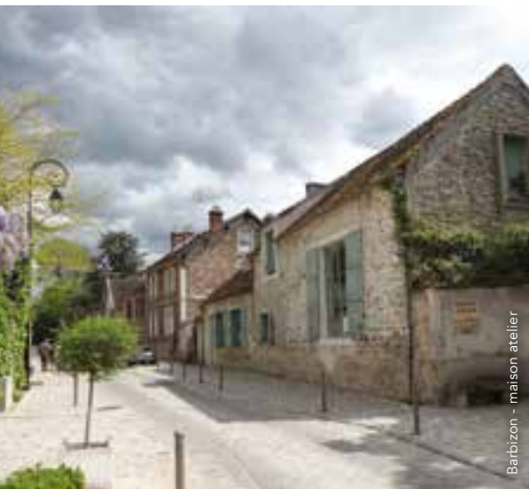
Barbizon - maison atelier

L'artiste a vécu et travaillé ici de 1849 à 1875, année de sa mort. C'est dans cet atelier qu'il a peint les scènes de la vie rurale de L'Angélu ou Les glaneuses , deux tableaux qui ont fait le tour du monde. Les murs abritent encore ses objets personnels et notamment sa correspondance, ses dessins et ses gravures. À voir aussi : une série d'œuvres originales des maîtres de l'école de Barbizon.