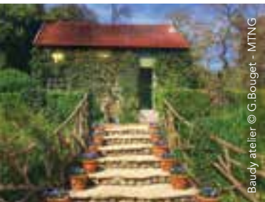
Baudy atelier

81 rue Claude Monet, 27620 Giverny Tél : 02 32 21 10 03 Le restaurant est ouvert tous les jours d'avril à novembre. Entrée libre pour la roseraie et le magasin de miniatures.