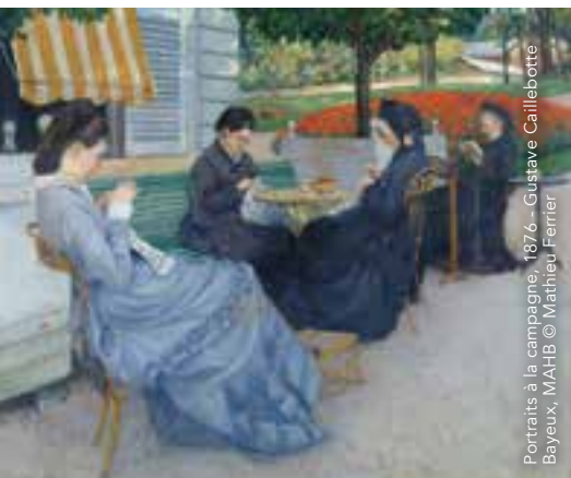
Portraits à la campagne, 1876 - Gustave Caillebotte Bayeux, MAHB