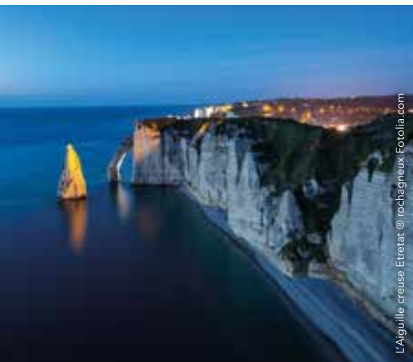
L'Aiguille creuse Étretat

Plusieurs itinéraires, illustrant chacun un thème impressionniste, font découvrir les lieux phares où les peintres ont posé leur chevalet à Dieppe , Fécamp ou Étretat . Jalonnés de tables de lecture, ces itinéraires vous permettront de découvrir, sur chaque site, une reproduction de la toile « in situ » avec des textes explicatifs. Un code à flasher permet d'en apprendre davantage sur le peintre et le tableau.