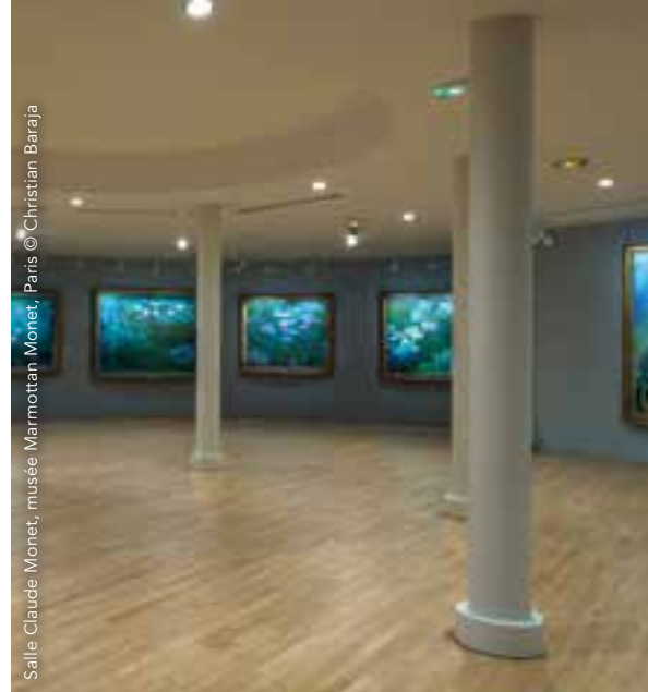
Salle Claude Monet, musée Marmottan Monet, Paris