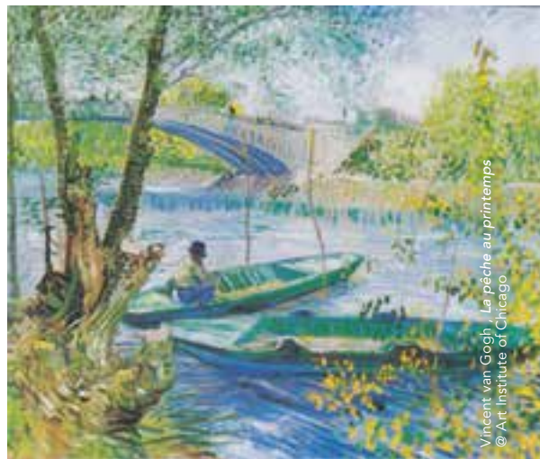
Vincent van Gogh, La pêche au printemps © Art Institute of Chicago

Du pont d'Asnières au pont de Clichy, partez à la découverte des paysages qui ont influencé ces célèbres peintres tels que Van Gogh, Émile Bernard, Paul Signac ou Seurat qui avaient choisi la ville comme lieu de résidence ou d'inspiration.