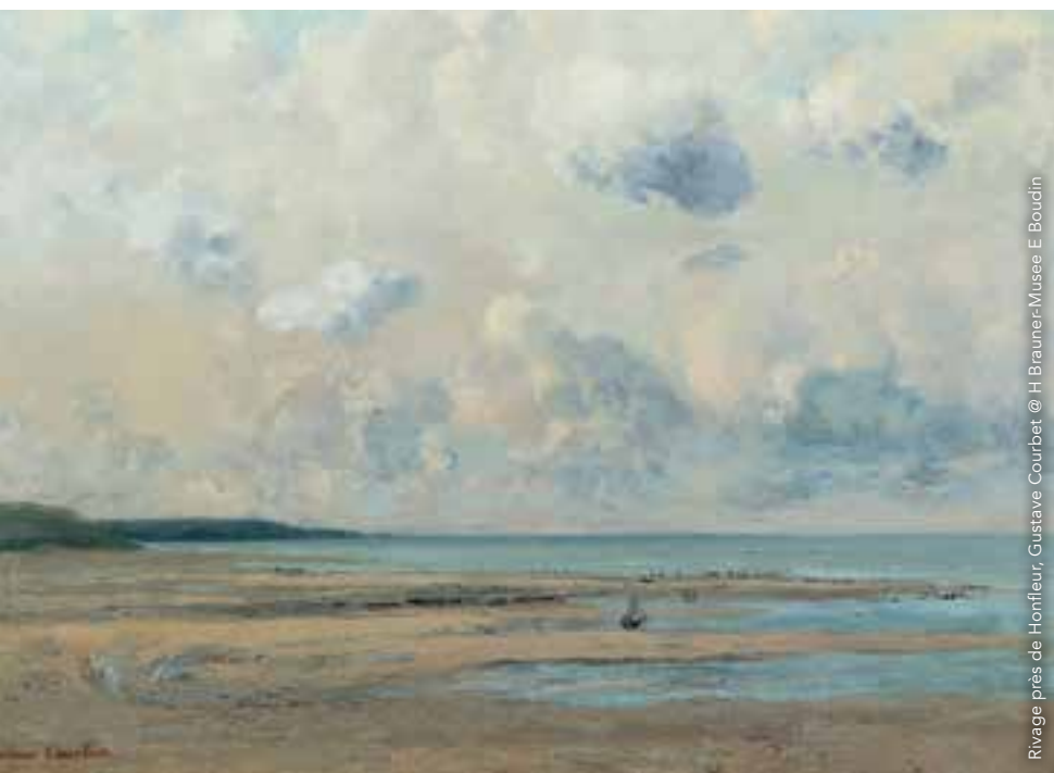
Rivage près de Honfleur, Gustave Courbet