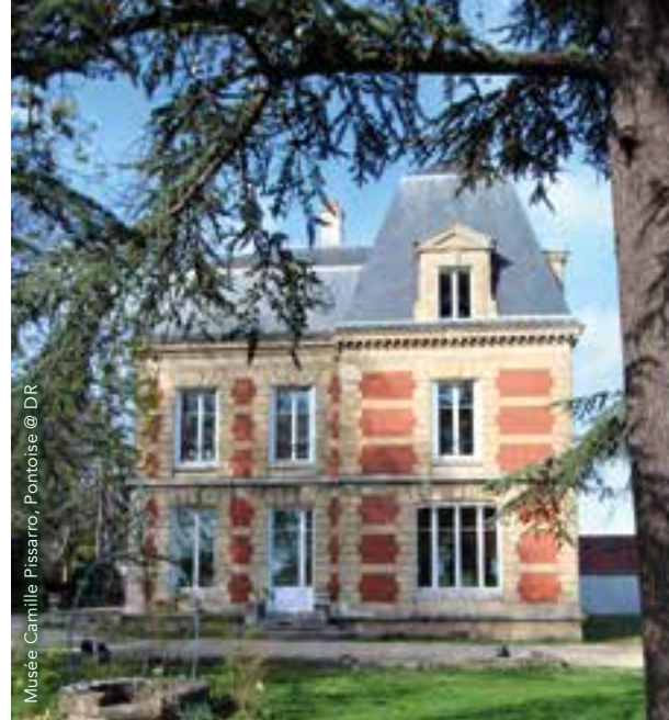
Musée Camille Pissarro, Pontoise

38 rue du Général de Gaulle, 95430 Auvers-sur-Oise Tél : 01 30 36 71 81 www.tourisme-auverssursoise.fr