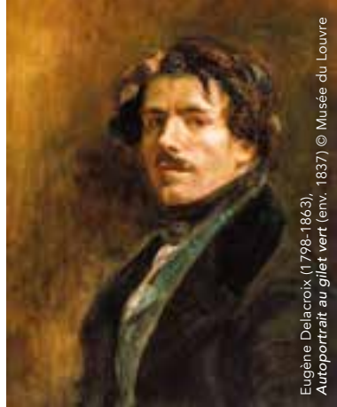
Eugène Delacroix (1798-1863), Autoportrait au gilet vert (env. 1837)

S'installer sur un banc, au pied de la chapelle Notre-Dame et contempler le coucher du soleil sur les falaises. Fasciné par ce spectacle, on comprend que Claude Monet y ait peint plus de cinquante toiles. Étretat fait partie des lieux mythiques de la Normandie qui ont envoûté les Impressionnistes.